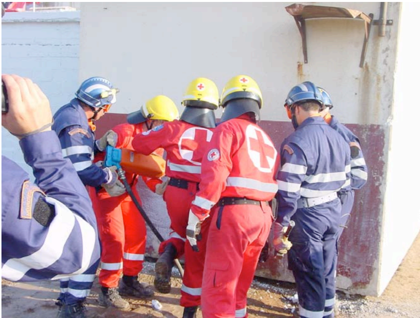
Εικόνα 4: Τεχνικές Απομάκρυνσης από Άμεσο Κίνδυνο

Η διάσωση από άμεσο κίνδυνο εφαρμόζεται όταν το θύμα πρέπει να απομακρυνθεί επείγοντως από έναν χώρο ή μια περιοχή όπου υπάρχει άμεσος κίνδυνος για τη ζωή και την υγεία του. Οι τεχνικές που χρησιμοποιούνται είναι στην ουσία τεχνικές μεταφοράς του θύματος με τα χέρια ή με πολύ απλά μέσα.