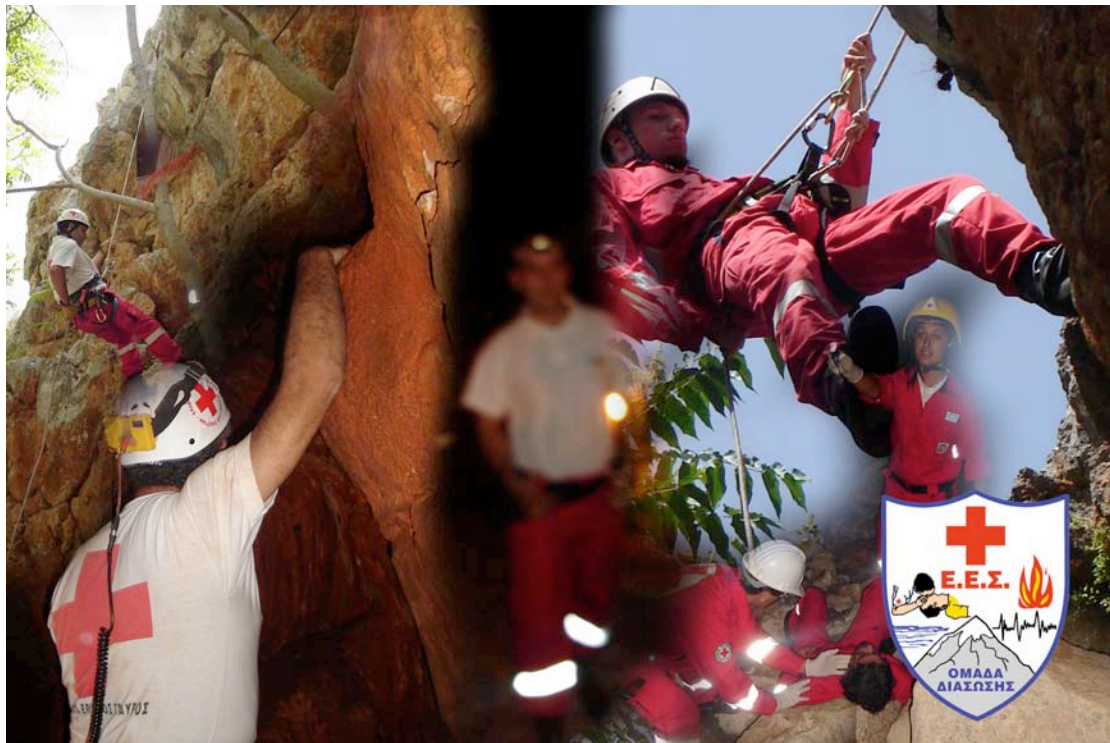
Εικόνα 10: Υπηρεσίες Διάσωσης του Ελληνικού Ερυθρού Σταυρού