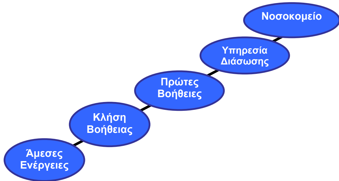
Εικόνα 3: Η Αλυσίδα της Διάσωσης

Θα πρέπει να εφαρμόζεται πάντα για την ασφάλεια των θυμάτων αλλά και την αποτελεσματικότητα των ενεργειών των αρωγών.