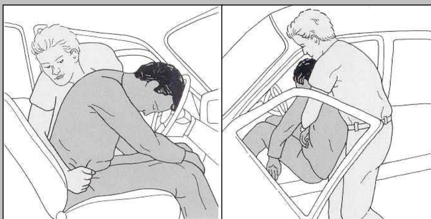
Εικόνα 16: Επείγων Απεγκλωβισμός από Αυτοκίνητο