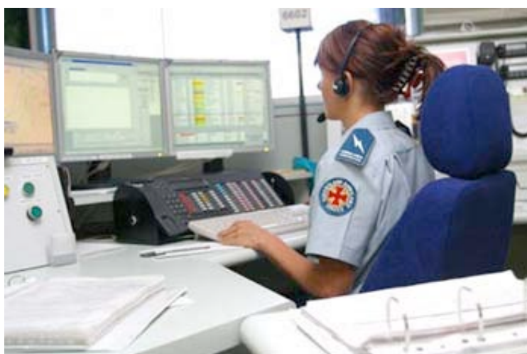
Εικόνα 5: Τηλεφωνικό Κέντρο Υπηρεσίας Εκτάκτου Ανάγκης

Καθ' όλη την διάρκεια της συνομιλίας μας, προσπαθούμε να είμαστε ψύχραιμοι, σαφείς και κατανοητοί. Δεν κλείνουμε ποτέ πρώτοι το τηλέφωνο, αλλά περιμένουμε πάντα να κλείσει πρώτος ο συνομιλητής μας.