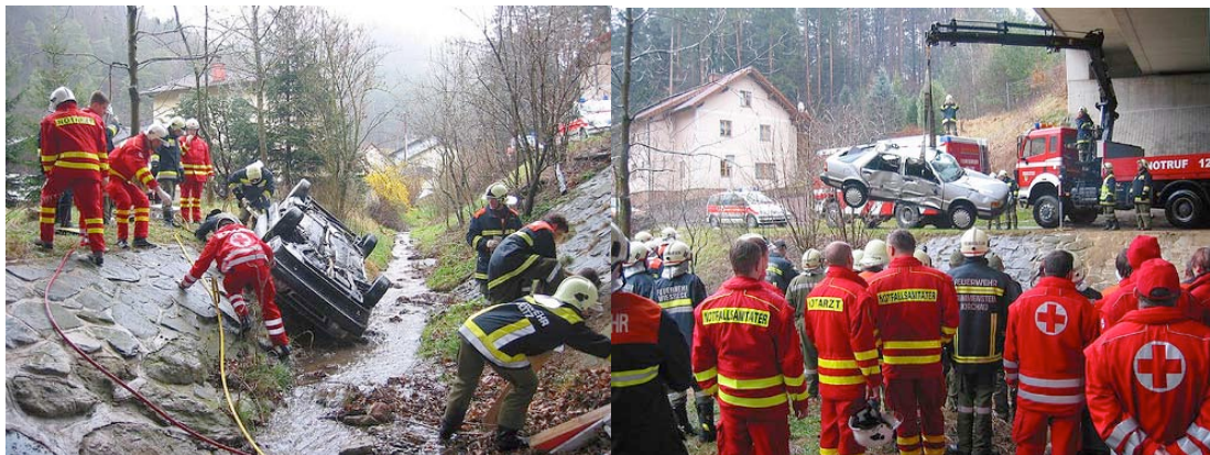
Εικόνα 13: Αντιμετώπιση Τροχαίου Ατυχήματος

Σε περίπτωση τροχαίου ατυχήματος θα πρέπει να γίνουν κάποιες βασικές ενέργειες ώστε να εξασφαλισθεί η ασφάλεια της σκηνής και να γίνει δυνατή η συνέχιση των επιχειρήσεων διάσωσης. Οι ενέργειες αυτές μπορεί να γίνουν από μια οργανωμένη ομάδα διάσωσης με πλήθος μέσων ή από τον οδηγό ενός διερχόμενου οχήματος. Ο αρωγός θα πρέπει να γνωρίζει πώς να αντιδράσει στον χώρο ενός τροχαίου ατυχήματος. Η σειρά των ενεργειών που αναφέρονται παρακάτω δεν είναι πάντα η ίδια αλλά μπορεί να μεταβάλλεται με γνώμονα την ασφάλεια του αρωγού.