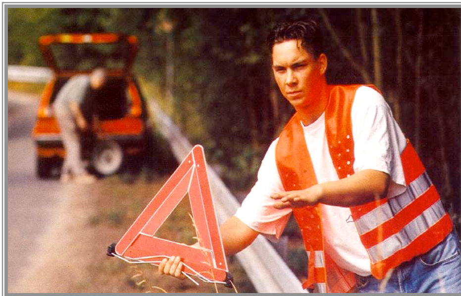
Εικόνα 14: Προειδοποιητικό Τρίγωνο σε χρήση

Το τρίγωνο τοποθετείται σε απόσταση 100 τουλάχιστον μέτρων από το σημείο του ατυχήματος. Αν μέσα στην απόσταση αυτή υπάρχει στροφή, το τρίγωνο θα πρέπει να τοποθετηθεί πριν τη στροφή. Αν ο δρόμος είναι διπλής κατευθύνσεως χωρίς νησίδα στη μέση θα πρέπει να τοποθετηθεί και δεύτερο τρίγωνο στο απέναντι ρεύμα κυκλοφορίας, με τον ίδιο τρόπο. Το τρίγωνο τοποθετείται σε απόσταση 70 εκατοστών περίπου από το άκρο της οδού, ώστε να είναι εμφανές από τους οδηγούς των επερχόμενων οχημάτων.