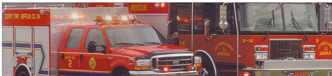
Εικόνα 9: Υπηρεσίες Διαχείρισης Ατυχημάτων και Διακομιδής