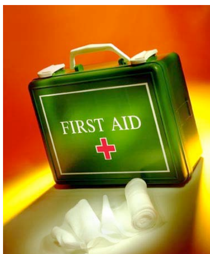
Εικόνα 2: Φαρμακείο Πρώτων Βοηθειών

Διάσωση , είναι το σύνολο των ενεργειών που γίνονται στον τόπο του ατυχήματος, με σκοπό τον άμεσο απεγκλωβισμό του ανθρώπου από τον κίνδυνο που απειλεί άμεσα τη ζωή του.