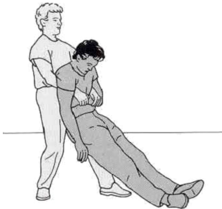
Εικόνα 11: Λαβή Rautek