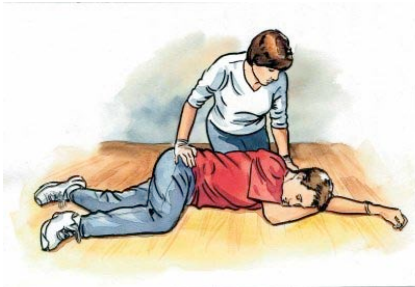
Εικόνα 7: Παροχή Πρώτων Βοηθειών