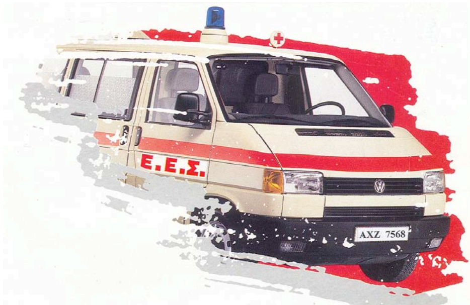
Εικόνα 8: Ασθενοφόρο Διάσωσης