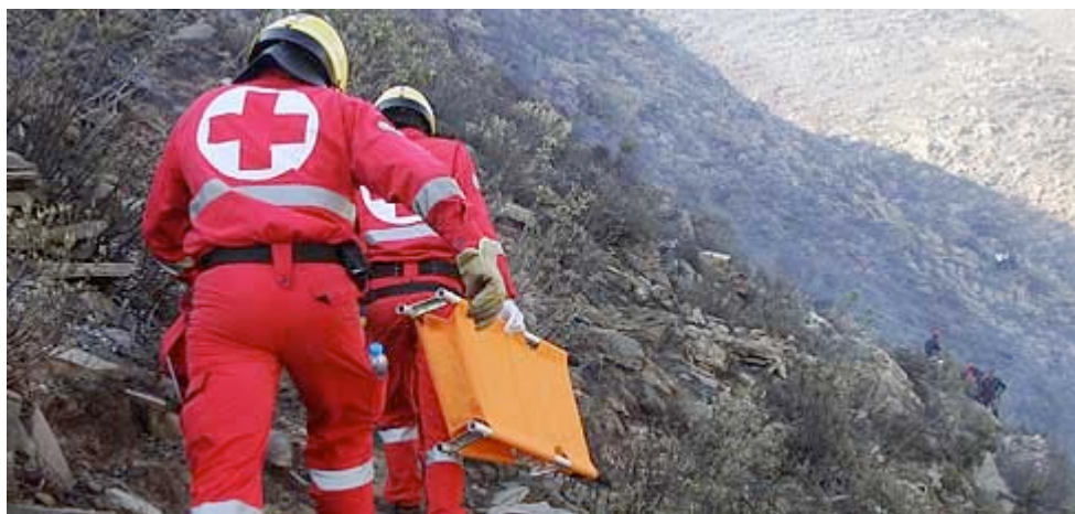
Εικόνα 6: Μεταφορά Φορείου σε δύσβατο σημείο