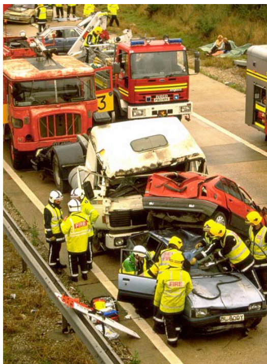
Εικόνα 1: Τροχαίο Ατύχημα

Τα ατυχήματα είναι μέρος της καθημερινής μας ζωής. Ένα ατύχημα μπορεί να συμβεί οπουδήποτε, οποτεδήποτε, και κάτω από οποιεσδήποτε συνθήκες. Τις περισσότερες φορές, τα ατυχήματα προκαλούνται από ανθρώπινη απροσεξία, ή μη τήρηση κανόνων ασφαλείας (π.χ. εργατικά ατυχήματα). Σπάνια τα ατυχήματα οφείλονται σε ανίκητες δυνάμεις της φύσης. Συνεπώς, μεγάλο ποσοστό των ατυχημάτων της καθημερινής μας ζωής μπορούν να αποφευχθούν. Όμως, κάποιο ατύχημα θα συμβεί. Όταν το ατύχημα έχει σαν αποτέλεσμα τον τραυματισμό κάποιου συνανθρώπου, τότε οι ενέργειες των παρευρισκομένων έχουν πολύ μεγάλη σημασία. Κατά τα λόγια του Αμερικανού στρατιωτικού χειρουργού Samuel, «η τύχη του τραυματία είναι στα χέρια του ανθρώπου αυτού που θα βάλει τον πρώτο επίδεσμο».